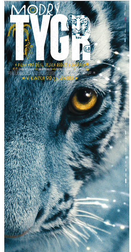
Kinderfilm „Der blaue Tiger“