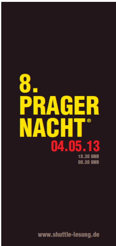
8. Prager Nacht