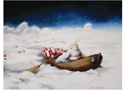
Ausstellung Pavel Matuška